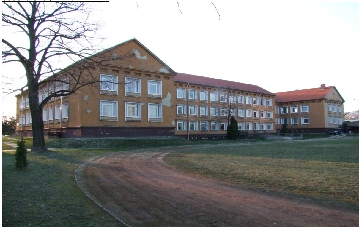
budova školy – súp.číslo 21